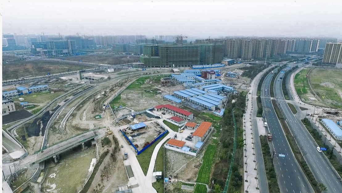
(规划的白石港公园与杭州蓬皮杜中心)