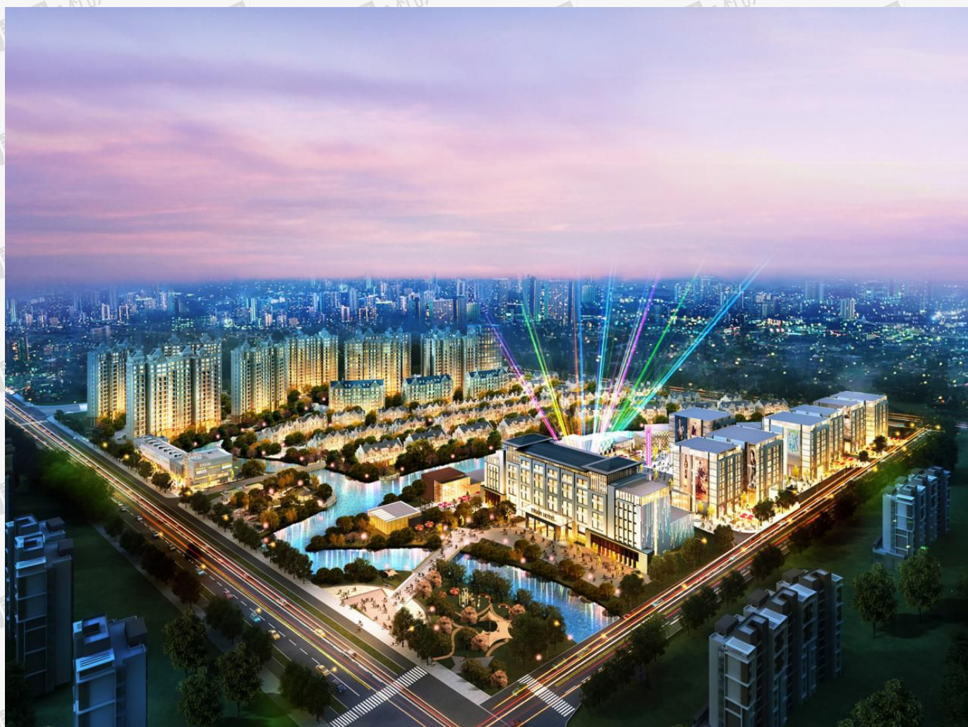
(大虹桥区域效果图)

2010年，上海虹桥站启用，高速公路、高铁、航空、地铁、磁悬浮形成“五维一体”快速交通网络。大虹桥范畴内的徐泾、佘山、江桥等区域房地产项目得到支撑，一线开发商入驻，新房均价从14900元到2015年的34000元，涨幅约为56%。