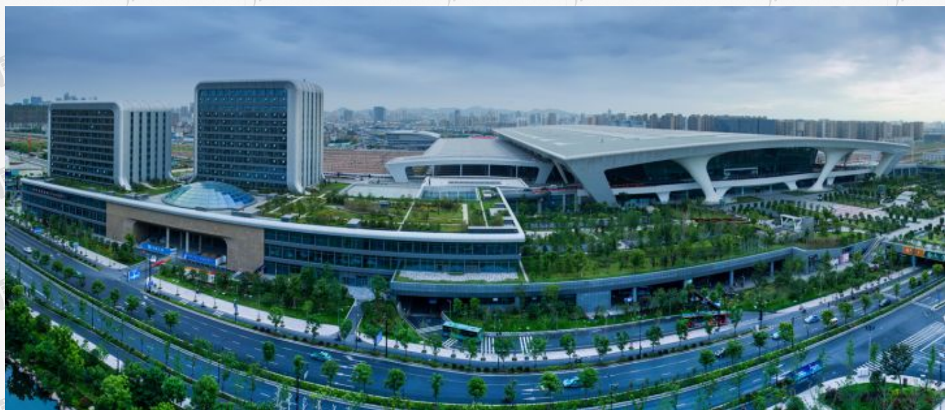
(杭州铁路东站枢纽西广场)

杭州铁路东站枢纽西广场： C、D塔楼地上地下体量25万方，加上裙房的总体量约为30万方。目前，地下已打造2000-3000方便民商业，未来或将与江干政府引进跨境物流。