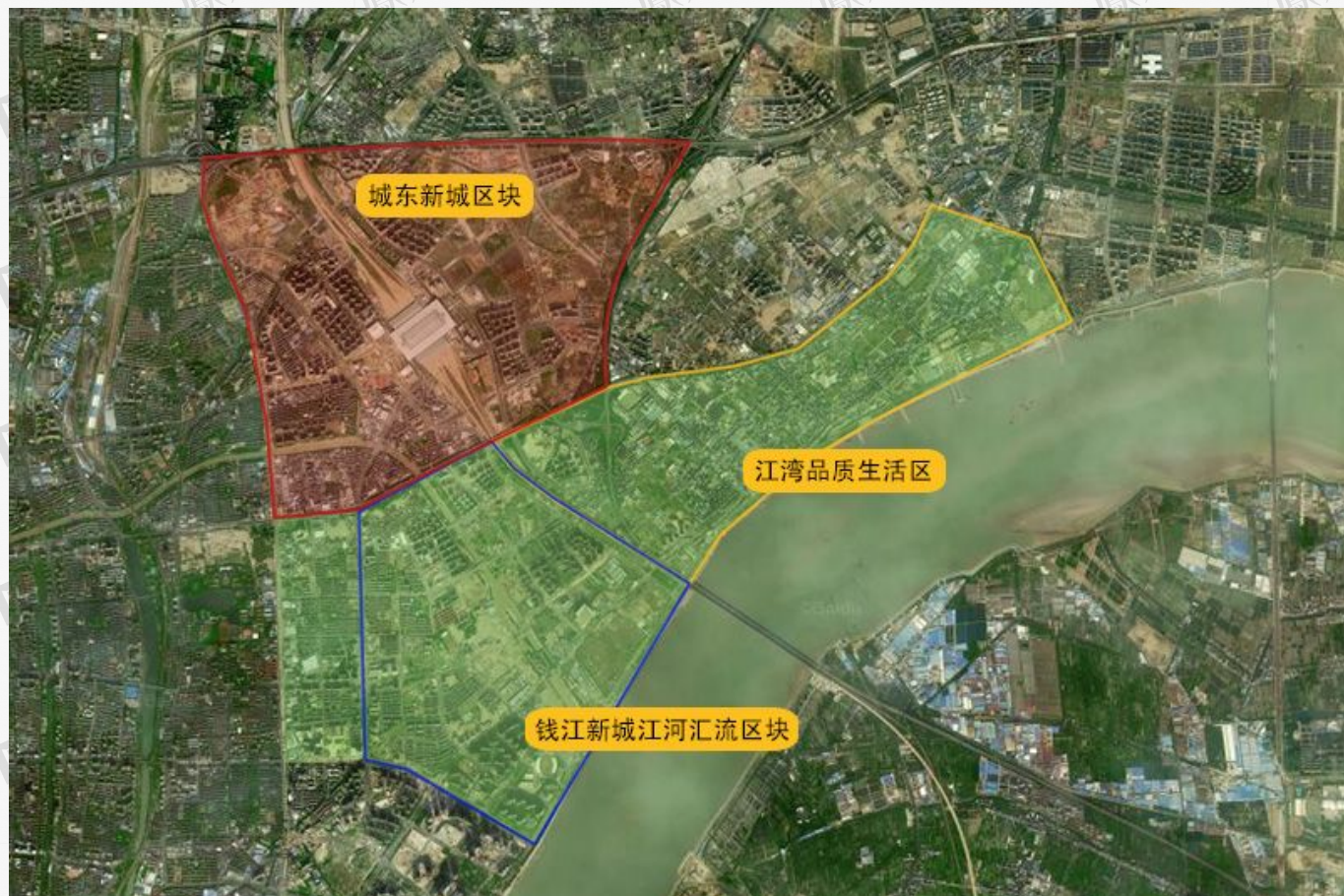
( 城东新城区块、钱江新城江河汇流区、江湾品质生活区位置图 )

1. 城东新城位于“一主三副六组团”总体布局结构的几何中心，南接钱江新城，东联下沙副城，是杭州实施“决战东部”战略的核心平台