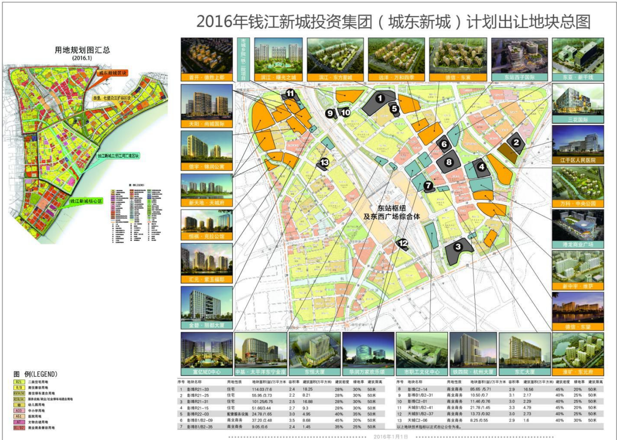
(2016年城东新城计划出让地块汇总)