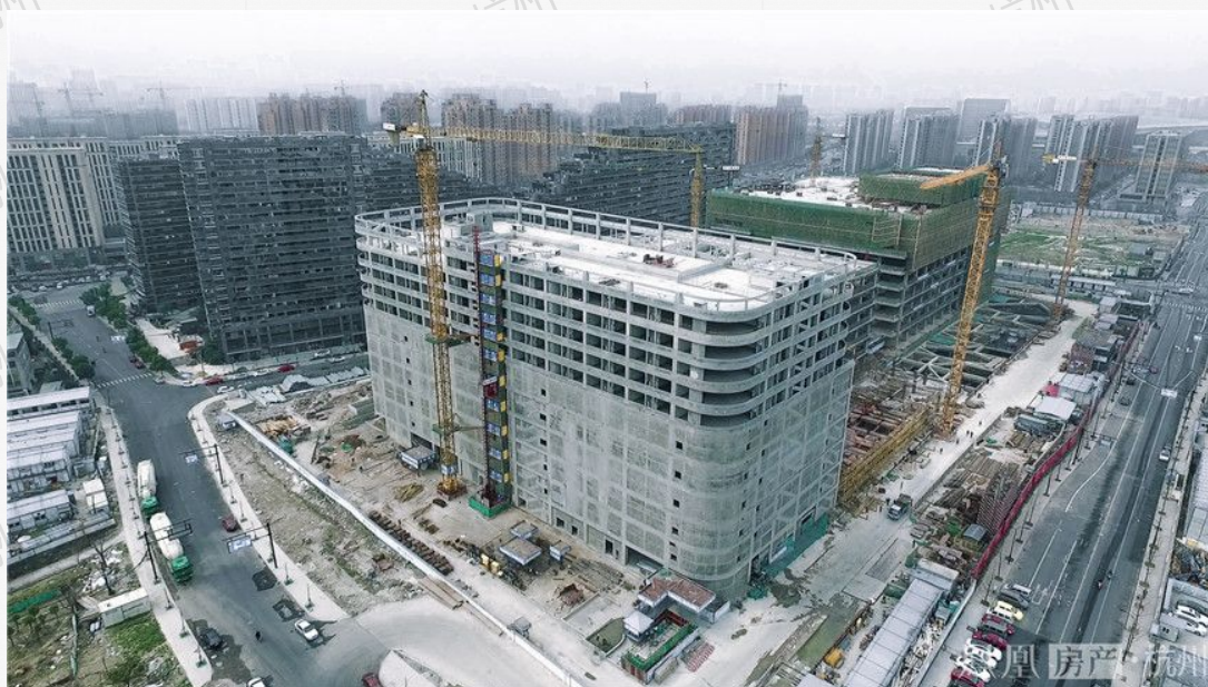
(杭州港龙城航拍图)