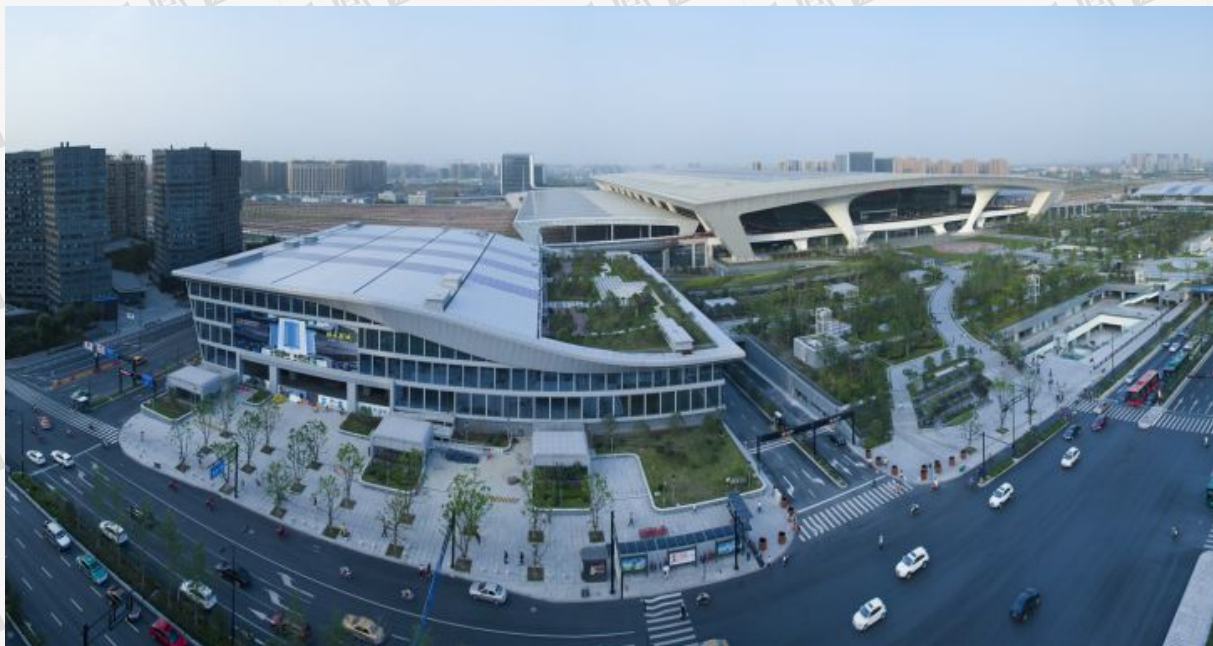
(杭州铁路东站枢纽东广场)

杭州铁路东站枢纽东广场： A座塔楼酒店地上地下体量10万方，顾家写字楼体量7.5万方，加上裙房总体量25万方。