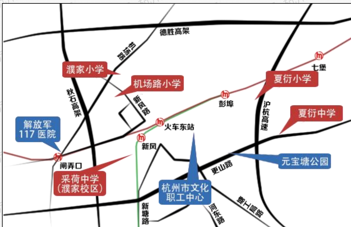
(城东新城主要配套图)

地铁： 1 号线经过站点（火车东站、彭埠站点）；4 号线经过站点（彭埠、火车东站、新风站点）