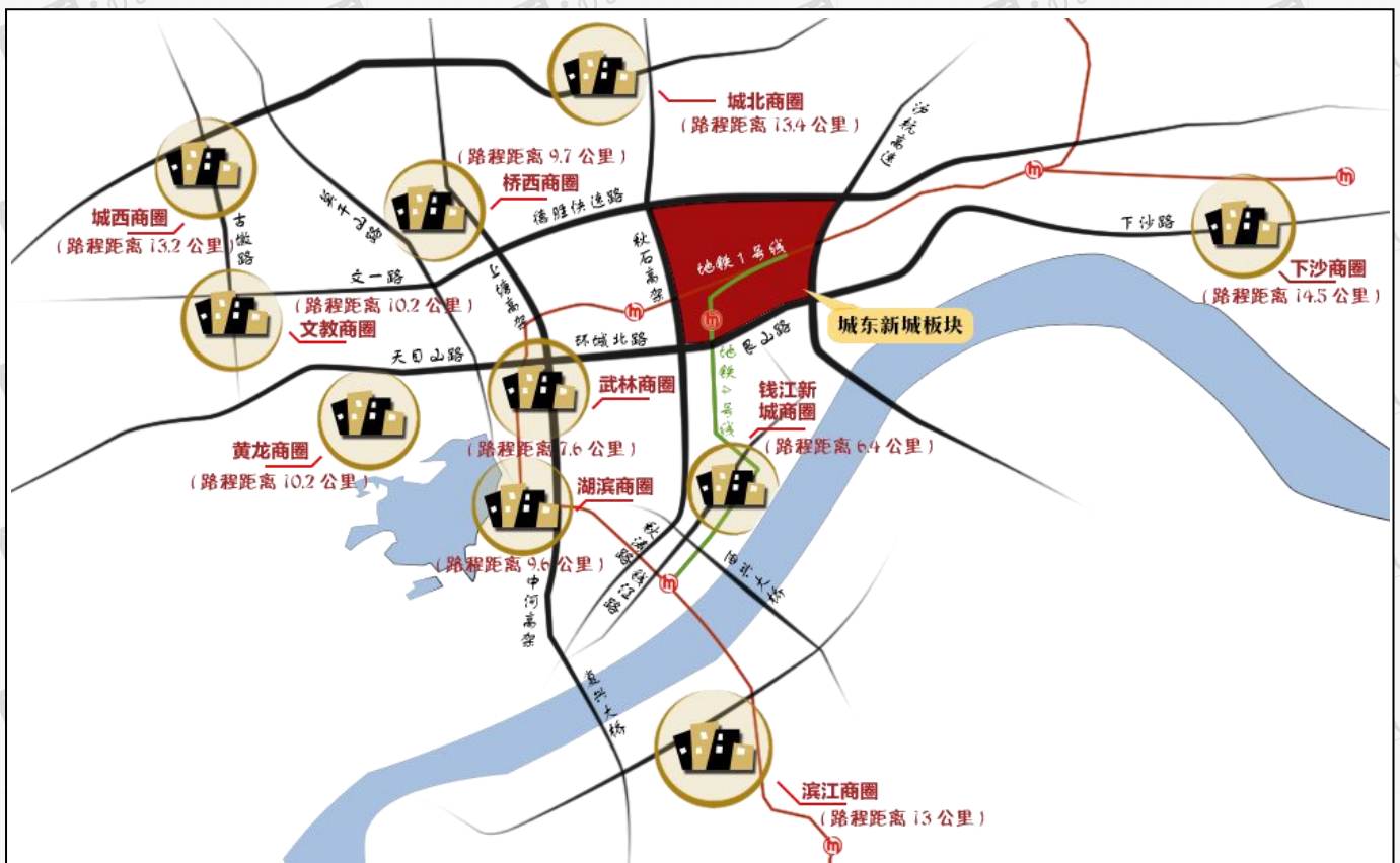
(城东新城与各商圈关系)