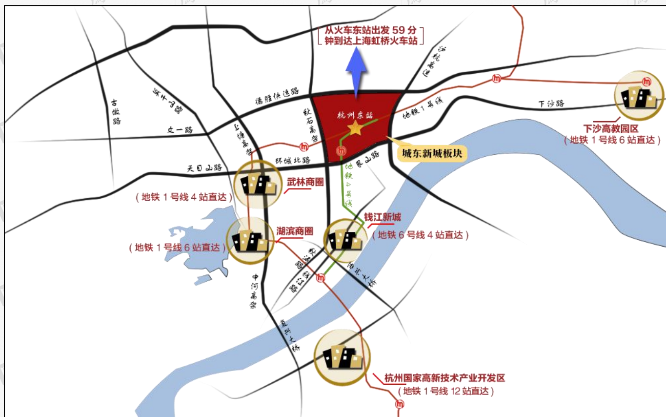
(城东新城与各区域的交通关系)