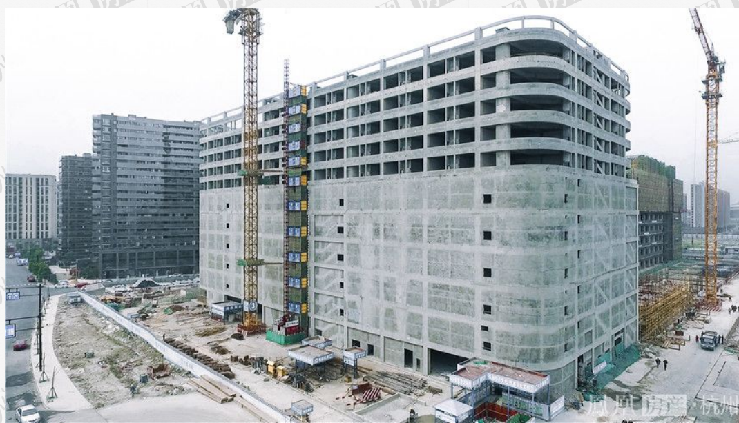
(杭州港龙城在建外立面)