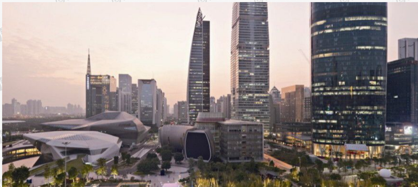
（番禺新城 CBD 效果图）

建站后 ：2005年6月，广州南站动工，番禺房价从4541元/平米升级至20000元/平米，部分豪宅直逼市区的40000元/平米；南站周边商铺价格上涨。交通、教育和商业配套完善。